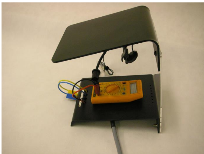
Mechanické uspořádání modulu CAM-OCR

Modul CamOcr je určen pro čtení 7-segmentových displejů. Počet digitů zobrazených na displeji musí být minimálně 3 a maximálně 8.